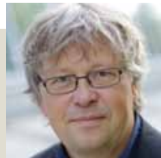
Moderation: Dirk Labusch